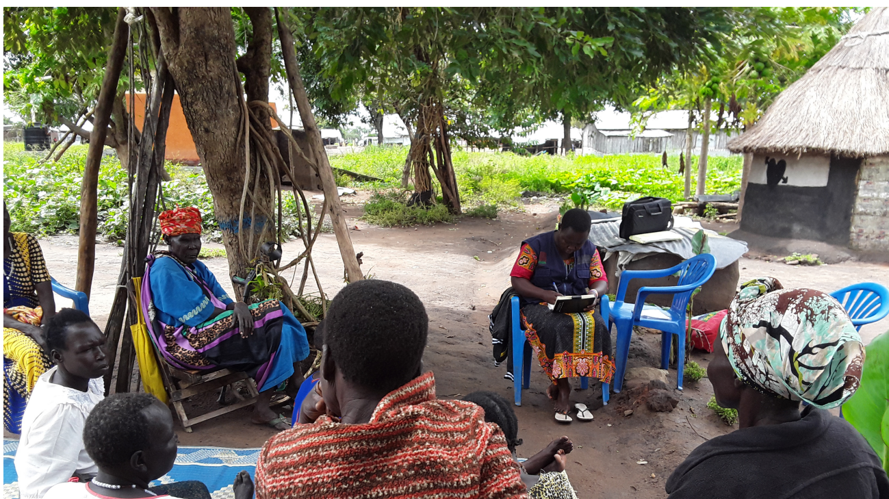
Mentoring-Sitzung der "Amanjara Women's Support Group" in Adjumani (Uganda), Refugee Law Project

Uganda, Heimat von 42,7 Millionen Menschen (Stand per 2018), davon 1,4 Millionen Geflüchtete (Stand per 30. Mai 2020), hat im Umgang mit den Bewegungen, die durch die fragile Geopolitik in der Region der Grossen Seen ausgelöst wurden, wichtige Fortschritte erzielt. Das im Vergleich zu einigen seiner Nachbarn relativ friedliche Land ist ein wachsendes Wirtschaftszentrum im laufenden Öffnungsprozess. Im Compendium of Conflicts in Uganda (2015) der Organisation Refugee Law Project ist nachzulesen, dass ein erheblicher Teil der ugandischen Bevölkerung selbst Opfer erzwungener Migration war.