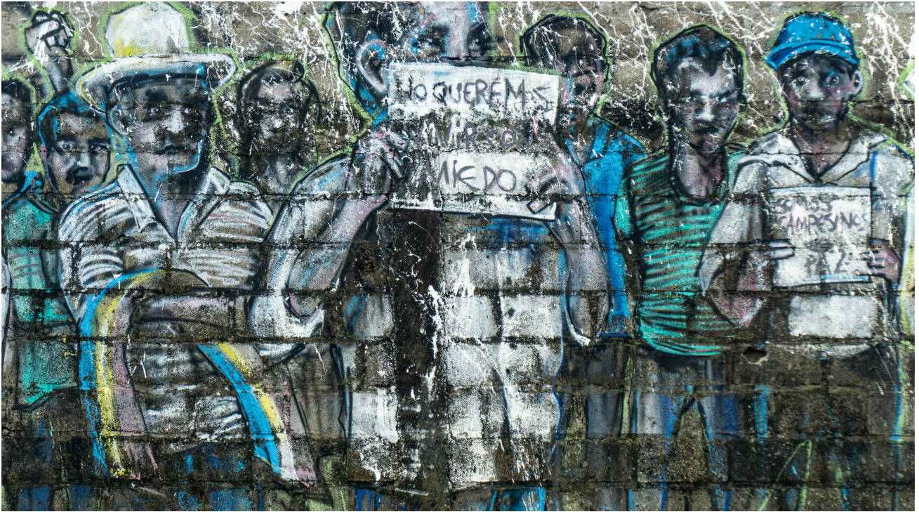
„Wir wollen nicht in Angst leben“, Wandbild in einem kolumbianischen Dorf, Nadine Siegle

Migration gibt es schon seit Anbeginn der Menschheit. Zum einen entfacht sie bei vielen zivilgesellschaftlichen Gruppen Solidarität, doch gleichzeitig führt sie in Aufnahmegesellschaften auch oft zu sozialer Ausgrenzung, Rassismus und Migrationsfeindlichkeit. In Kolumbien sind Letztere während der anhaltenden COVID-19-Pandemie in den Vordergrund gerückt. Im Rahmen einer Interview-Reihe mit Akteur_innen aus Venezuela, Kolumbien und der Schweiz, haben wir über dominante Narrative und Bilder in Bezug auf Migration in Kolumbien und speziell zur Einwanderung aus Venezuela gesprochen.