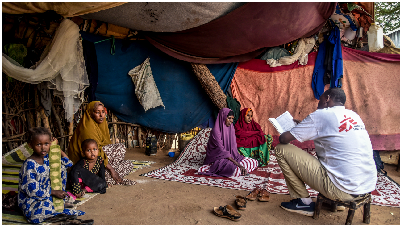
Lager in Dagahealey, Kenia, September 2019

Die steigende Zahl der Vertriebenen weltweit hat die internationale Gemeinschaft dazu veranlasst, ihren Ansatz in Bezug auf Vertreibung und Migration zu überdenken. In diesem Sinne sind die New Yorker Erklärung, der Global Compact on Refugees (GCR) und der Global Compact for Migration (GCM) zwischen 2016 und 2018 unter der Schirmherrschaft der UN-Mitgliedstaaten (MS), des UNHCR und der IOM ins Leben gerufen worden.