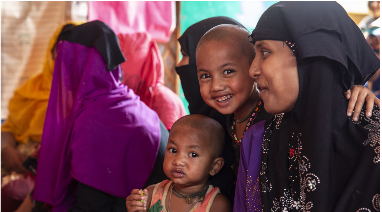
Geflüchtete Rohingya, Bangladesh, April 2019, Helvetas